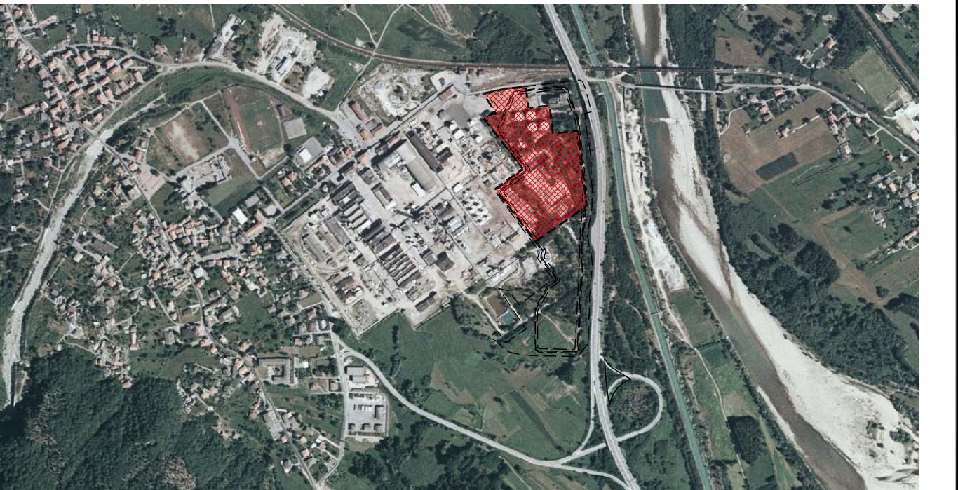
VISTA AEREA DELL'AREA IN ESAME